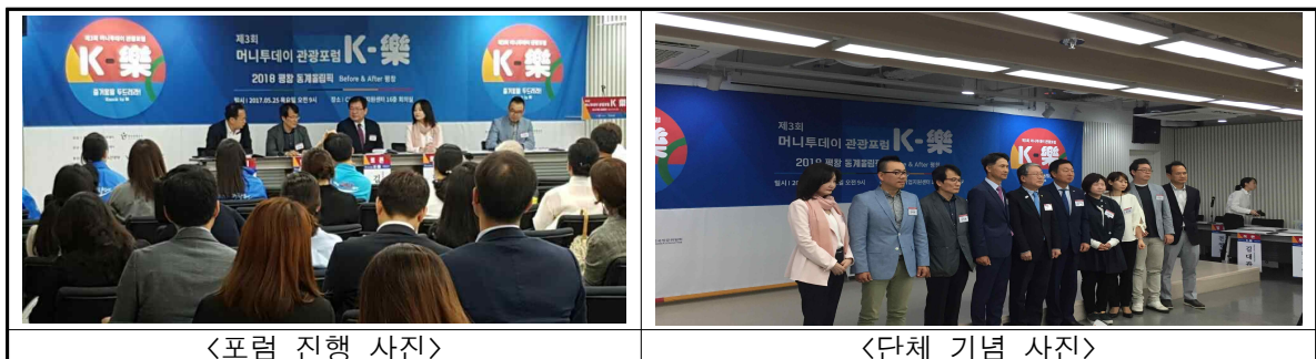
<포럼 진행 사진>