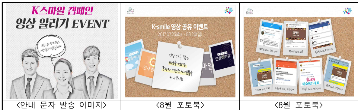
<안내 문자 발송 이미지>