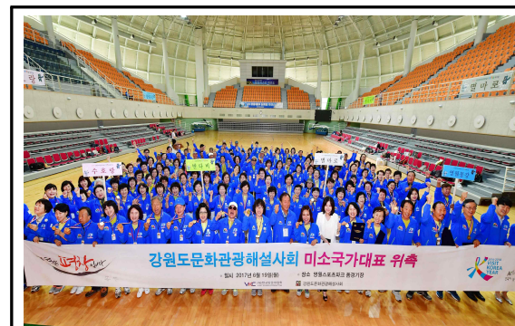
<강원 문화관광해설사회 단체사진>