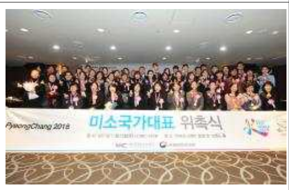
<참석자 전체 기념촬영>