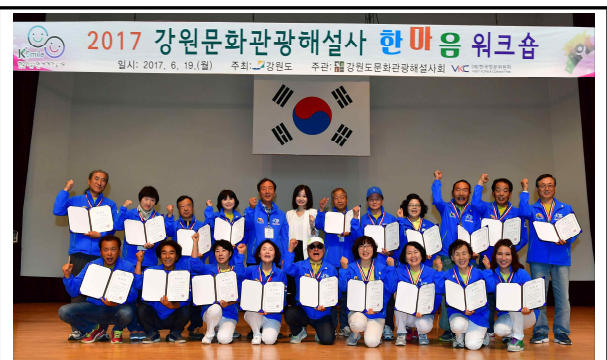
<대표 수여자 기념촬영>