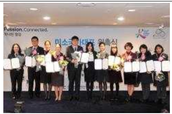
<접점별 대표 단체사진>