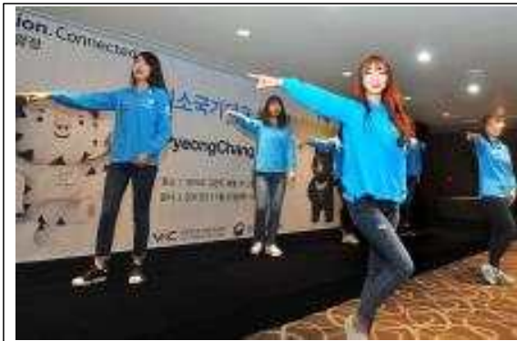
<대학생 미소국가대표 플래시몹 퍼포먼스>