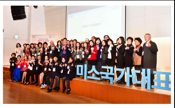
<참석자 전체 기념촬영>