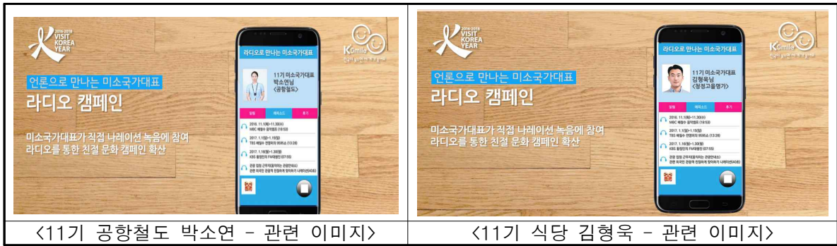
<11기 공항철도 박소연 - 관련 이미지>