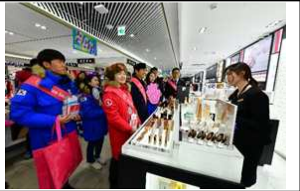
<친절결의대회 연계 K스마일 캠페인>