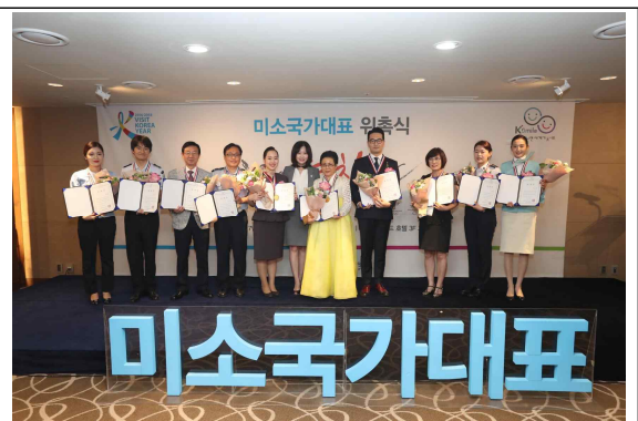
<접점별 대표 단체사진>