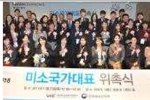
<참석자 전체 기념촬영>