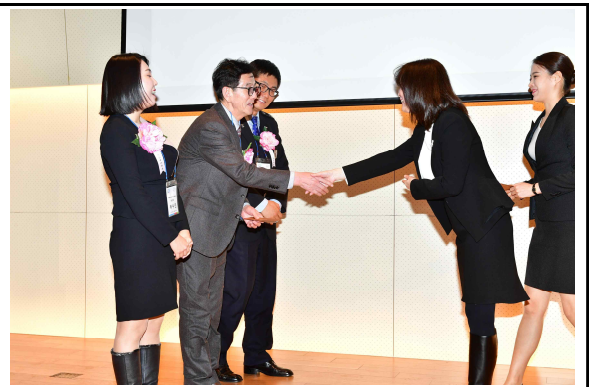
<활동 우수자 상장 수여>