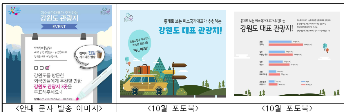
<안내 문자 발송 이미지>