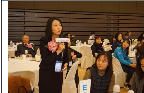
<우수사례 및 의견 교류>